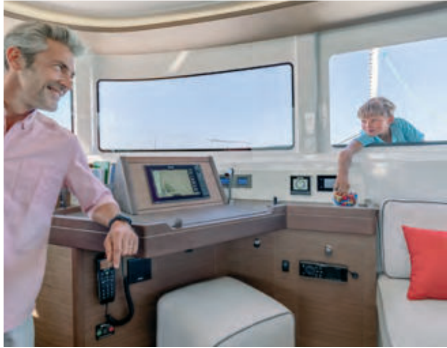
VITRAGE COULISSANT OUVERT. SLIDING SASH WINDOW OPENED.