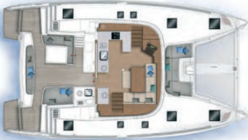
Carré et cockpit / Saloon and cockpit