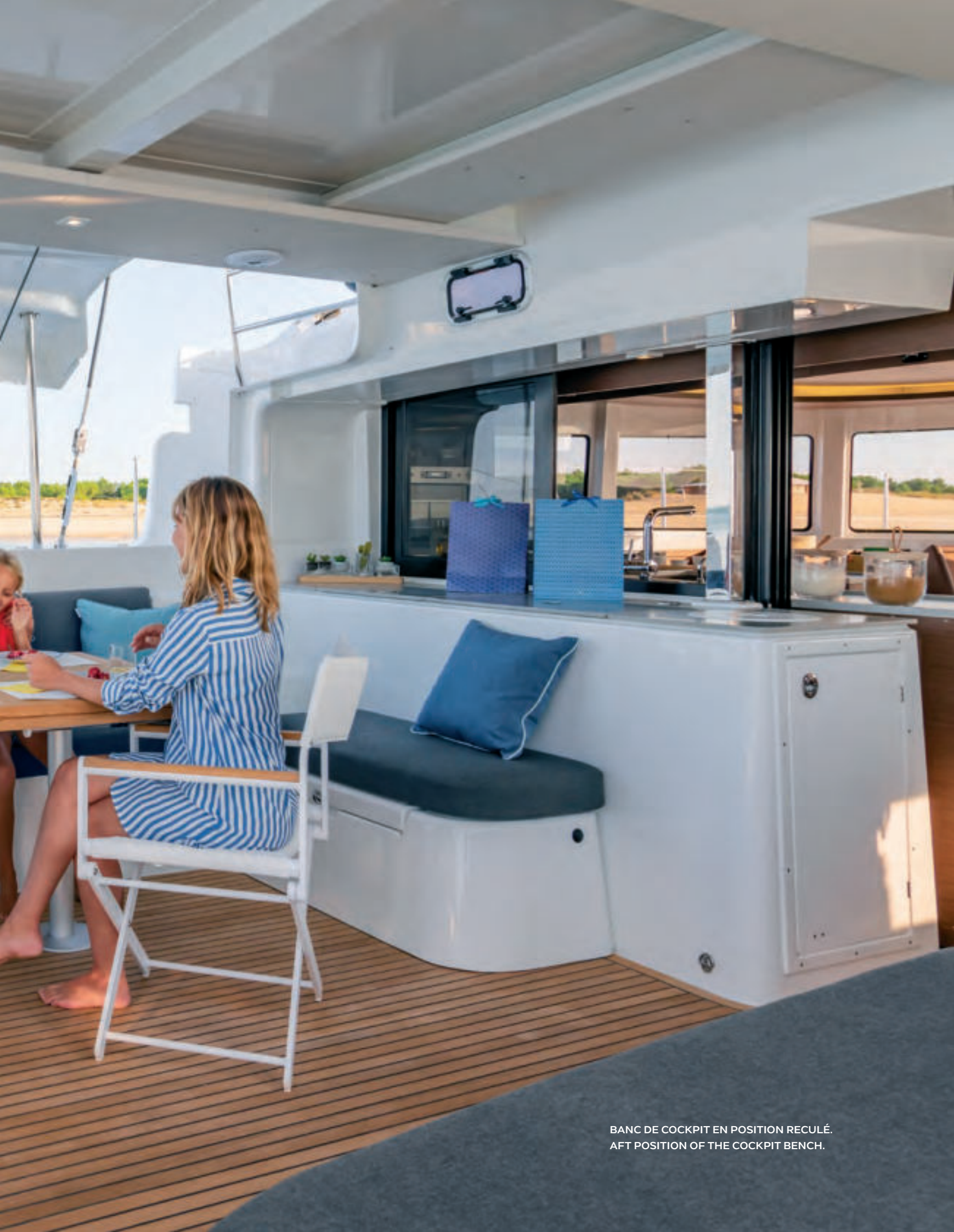
BANC DE COCKPIT EN POSITION REULÉ. AFT POSITION OF THE COCKPIT BENCH.